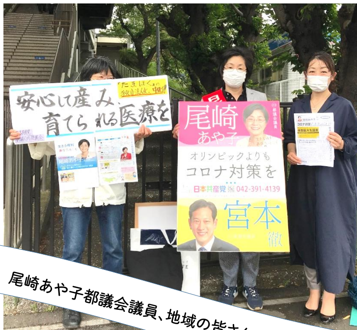
尾崎あや子都議会議員、地域の皆さんと武蔵大和駅